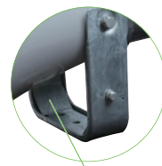
ブラケットが二重に補強されています