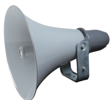
●防災行政無線用レフレックスホーンスピーカー

新防災行政無線用レフレックスホーンスピーカー 従来機種から約0.4kgの軽量化 ネオジウムマグネット採用60Wモデルを新たにラインナップ