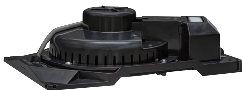
●スプリングキャッチ式天井スピーカー(16cmタイプ)

PR-1760 ¥4,900 (税抜価格) PR-1760L ¥6,900 (税抜価格) (アッテネーター付)