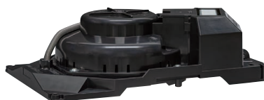
●スプリングキャッチ式天井スピーカー(12cmタイプ)

PR-1760 ¥4,900 (税抜価格) PR-1760L ¥6,900 (税抜価格) (アッテネーター付)